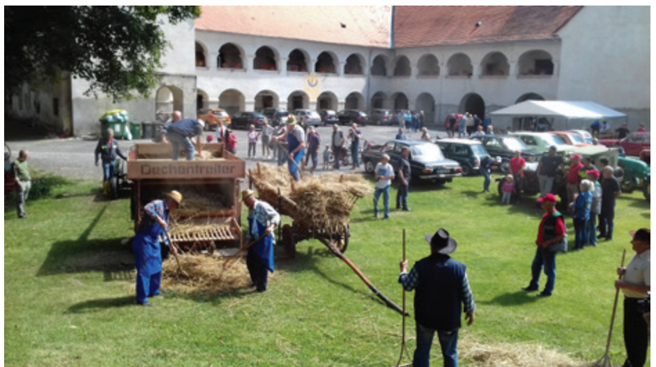
V beltinskem parku je zapela mlatilnica iz leta 1935

Žetev zlatega pšeničnega klasja v deželi ob Muri je že končana in zrnje je večinoma že v kaščah. Letošnja žetev je bila kljub slabemu vremenu še kar dobra. Pšenično klasje so večji del poželi kombajni, kmetije in tržni pridelovalci pa so pšenico odpeljali na bližnja odkupna mesta. Pri prodaji pšenice so spet kratko potegnili kmetje in pridelovalci, saj so za tono prodane pšenice dobili manj kot lansko leto. Da pa spomin na nekdanje čase v času žetve ne bi šel v pozabo, se je Klub ljubiteljev stare kmetijske tehnike in ostale tehnike Pomurja s sedežem v Beltincih odločil, da s svojimi člani obudi in prikaže ročno žetev pšeničnega klasja in mlatitev požete pšenice s staro mlatilnico iz leta 1935, nemške izdelave.