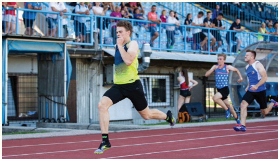
Maj v teku na 200 m, DP Nova Gorica