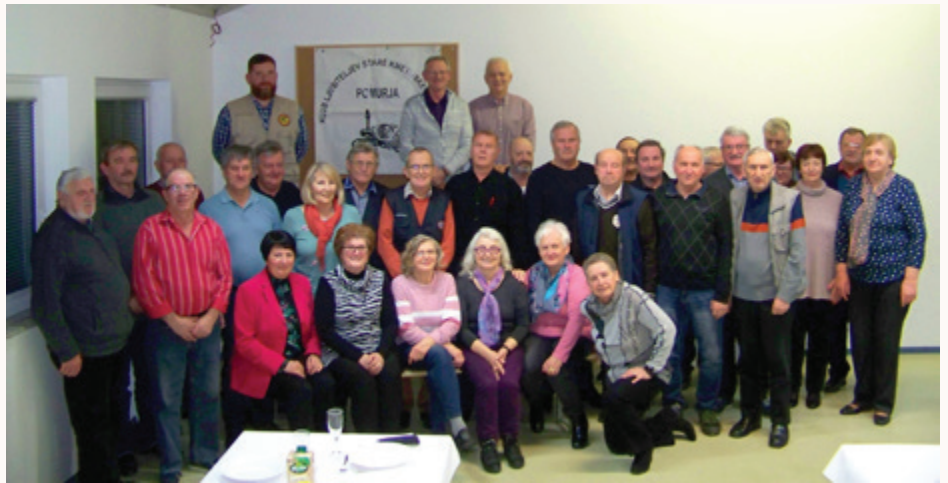
Ključne naloge kluba so ohranjanje kulturne dediščine in kmečkih opravil

V maju smo izvedli že tradicionalno košnjo trave z ročnimi kosami, a zaradi