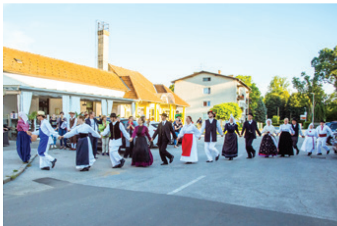
Letošnji glasbeni tabor je potekal na prizorišču prvega Foklornega festivala v Beltincih