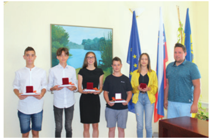
Naknadni sprejem devetošolcev pri županu Občine Beltinci