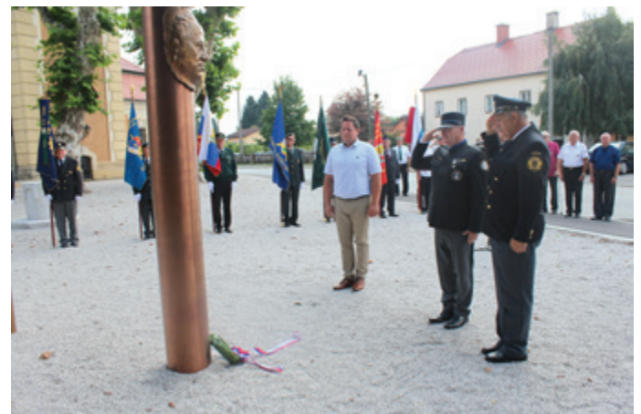
Položitev venca k obelžitvi obletnice priključitve Prekmurja k matični domovini