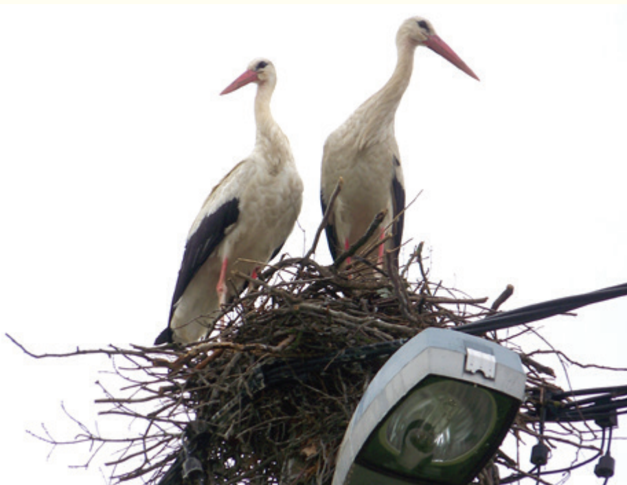
V Beltincih, v Ulici Štefana Kovača, si samec in samica spletata nov domek-gnezdo

Kmalu bo prišel čas, ko bo jata štorkelj, ki je spomladi priletela v svoja spletena gnezda na dimnikih, električnih in telefonskih drogovih v deželo ob Muri, morala spet zapustiti kraje ob reki Muri in se vrniti v toplo afriško celino. V domala vseh gnezdih so v teh dneh že zrasle mlade štorklje, ki bodo skupaj s svojimi »starši« in ostalimi štorkljami zapustile domove v deželi ob Muri. Pred časom je eno od gnezd v občini Odranci, ki je tehtalo 700 kg, padlo na tla. V njem so bile tri mlade štorklje, pa so poginile. Starejše štorklje so bile tisti hip na travniku in iskale hrano za mlade štorklje. Tako sta dve štorklji, samica in samec, ostala brez »doma«, a sta si nov dom našla v Beltincih. Ker pa še ni prišel čas selitve štorkelj, sta si po mnenju domačinov v Ulici Štefana Kovača v Beltincih v teh dneh začela na novo spletati novo gnezdo iz šibja in drugega naravnega materiala. Najraje si material za gnezdo nabirata v zgodnjih jutranjih urah. Spletanje gnezda je namreč za samico in samca dolgotrajno opravilo, saj vse počneta s kljunom. Za občane Beltincev, še posebej pa za prebivalce ulice Štefana Kovača je to nekaj posebnega, kajti doslej na tem električnem drogu še ni