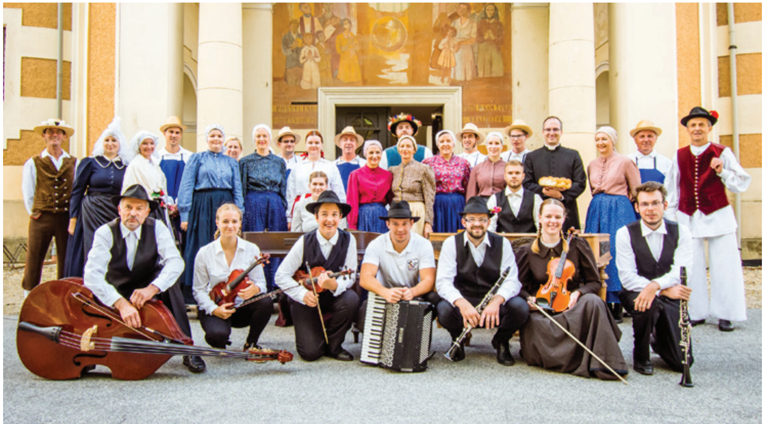
Nastop folkloristov pred beltinško cerkvijo